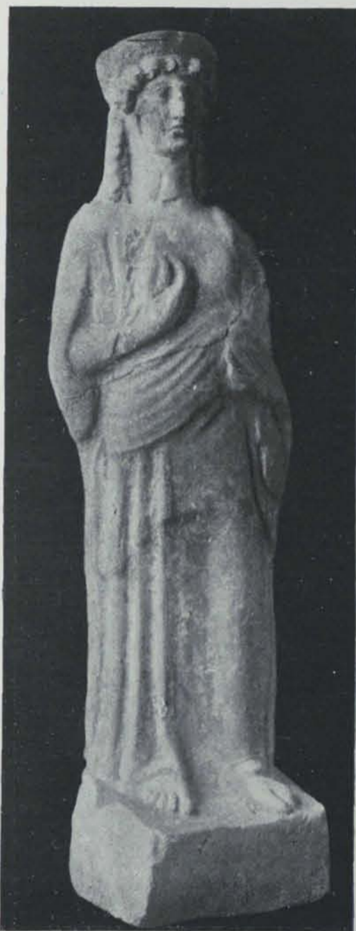
Fig. 165. — Ibiça. Necròpolis del Puig des Molins. Terra cuita

La necròpolis ocupa gran part del vessant d'un turó, proper a la moderna ciutat, començant ja al cim i estenent-se per la falda del dit turó (fig. 158). Els sepulcres, segons les dades facilitades