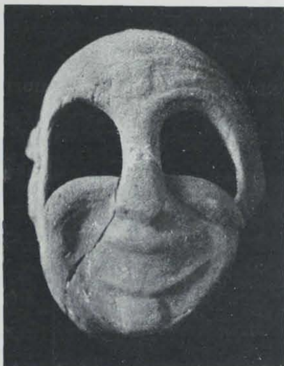
Fig. 162. — Ibiça. Necròpolis del Puig des Molins. Terra cuita