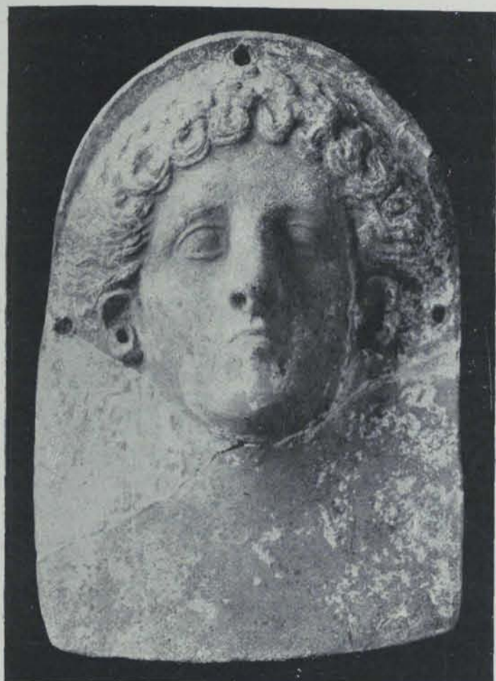
Fig. 161. — Ibiça. Necròpolis del Puig des Molins. Terra cuita

Aquí és impossible fer altra cosa que una ressenya sumària dels més notables de dits objectes, sense intentar cap publicació en regla. Es troba una informació sobre les necròpolis cartagineses