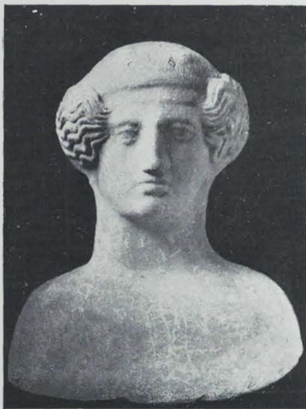
Fig. 164. — Ibiça. Necròpolis del Puig des Molins Terra cuita

d'Ibiça a la bastant copiosa bibliografia (1) que ja existeix sobre l'arqueologia de la illa, i s'espera la publicació de les excavacions del prof. Vives, que, segurament, aclarirà moltes qüestions interessants. Prescindirem dels objectes de la Illa Plana