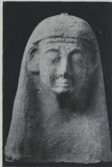
Fig. 166. — Ibiça. Necròpolis del Puig des Molins. Terra cuita

menes i fins monedes i ceràmica romana, sembla versemblant creure que la utilització durà des del segle V a. de J.-C. fins als primers temps de l'Imperi romà.