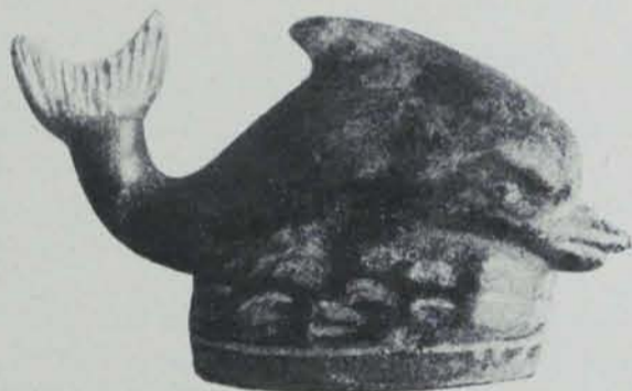
Fig. 163. — Ibiça. Necròpolis del Puig des Molins. Vas hel·lenístic

Aquí és impossible fer altra cosa que una ressenya sumària dels més notables de dits objectes, sense intentar cap publicació en regla. Es troba una informació sobre les necròpolis cartagineses